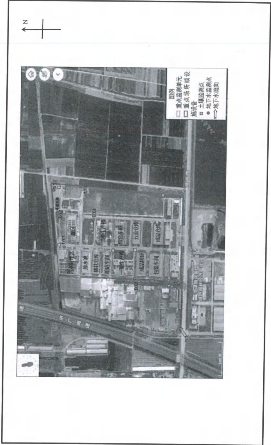
附图 1: 布点示意图